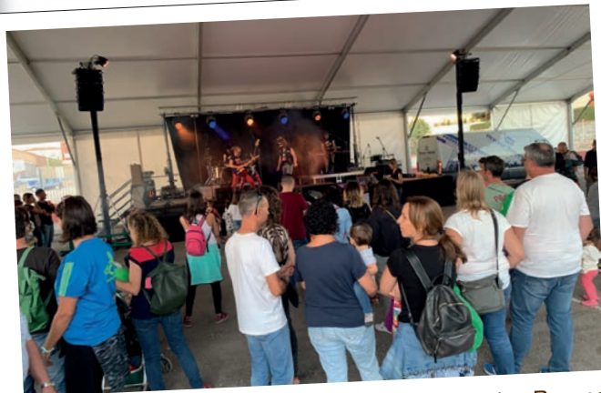
Concert de Rock per a xics, a Lo festivalet de les Borges.