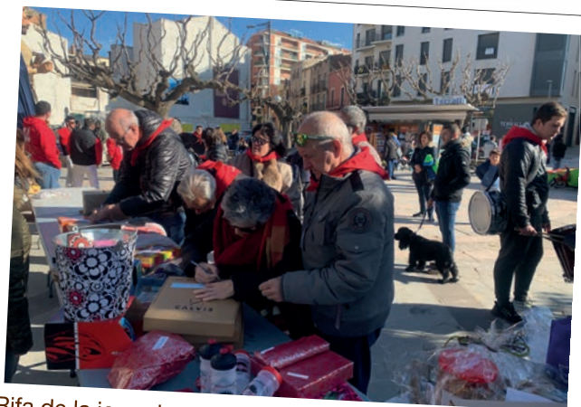
Rifa de la jornada solidària per recaptar fons en benefici dels damnificats pels aiguats a les Garrigues.