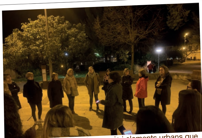
Passejada per a detectar espais i elements urbans que generen percepció de seguretat, inseguretat o llibertat a les dones quan es desplacen de nit.