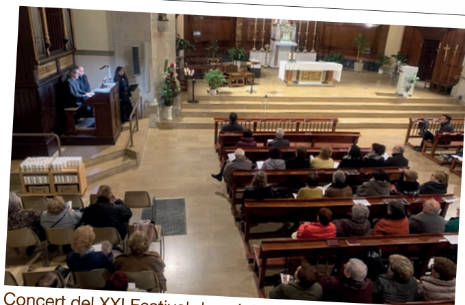
Concert del XXI Festival de música de tardor - Orgues de Ponent i del Pirineu.