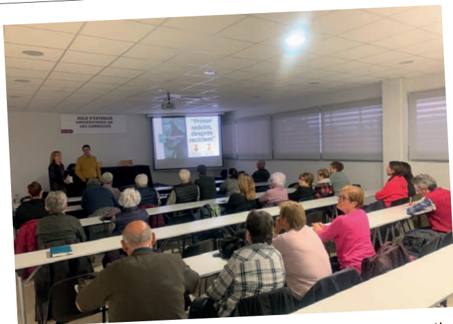
Xerrada 'el millor residu és el que no produeix', en motiu de la Setmana Europea de la Prevenció de Residus.

Butlletí d'informació municipal Desembre 2019 | Num. 23