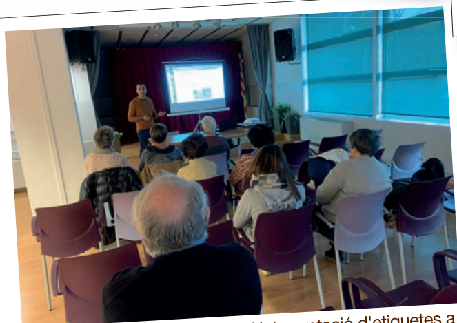
Xerrada sobre la lectura i interpretació d'etiquetes a càrrec de l'Associació de Diabetis de Catalunya.