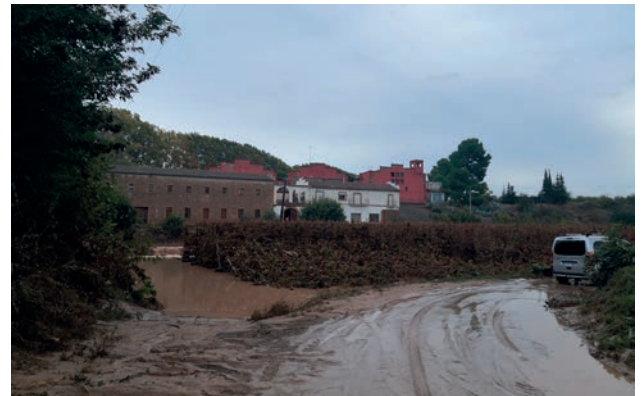
■ Alguns dels efectes del temporal que es va viure a les Borges aquest octubre