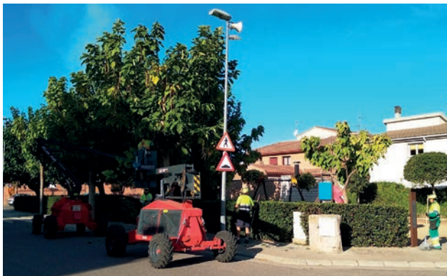
■ Els treballs d'esporga 2019 a les Borges Blanques.

El consistori borgenc enllesteix la urbanització dels carrers Maria Lois i Avemaria, un cop adjudicades les tasques després de les pertinents licitacions. En el cas del carrer Maria Lois, la inversió arribarà fins als 48.915 euros i en el del carrer Avemaria el pressupost de licitació arribava fins als 186.744. En tots dos casos, es tracta d'obres que impliquen actuacions a les voreres, el paviment i l'enllumenat i altres elements de la via. ■