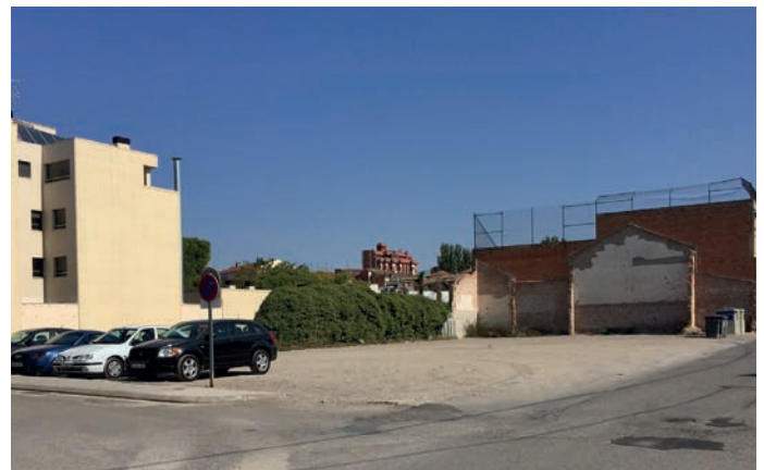
■ El solar on s'ubicarà el futur Teatre municipal polivalent de les Borges

Doncs, a més a més d'aquesta millora en la gestió financera, després d'haver liquidat el préstec més important existent, que ha durat 15 anys, subscrit l'any 2004 per 4,2 milions d'euros, per eixugar els deutes contrets fins al moment i pendents de pagament. Per tant, suposa un estalvi significatiu, passant d'amortitzar 445.000 euros encara el 2019 a 177.000 euros per aquest 2020. I en aquesta mateixa línia hem de mencionar les concessions municipals, com és la gestió de l'aigua i altres espais de titularitat municipal, que suposaran uns majors ingressos de prop de 150.000 euros. ■