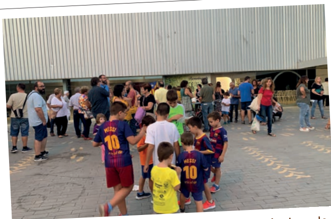
Commemoració del segon aniversari del referèndum de l'1 d'octubre.