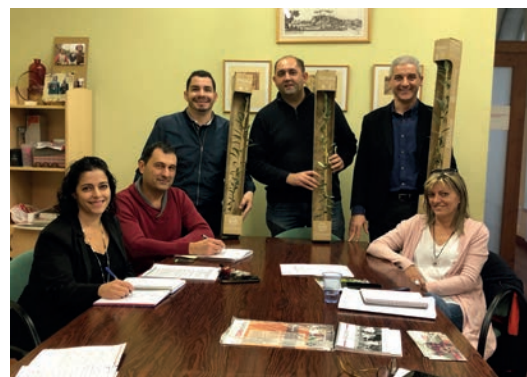
La reunió entre ACUDAM i la Fira de l'Oli i les Garrigues per acordar l'apadrinament d'oliveres solidàries amb els municipis afectats pels incendis i els aiguats

Finalment, Ribalta ha destacat que "el certamen avui és la Fira de tots i totes, ja que s'ha despolititzat moltíssim, s'hi convida i es rep amb educació i respecte a tots els representants institucionals que hi volen assistir, siguin del color que siguin, i estem sempre oberts a rebre propostes de millora de tots els qui vulguin contribuir a seguir-la fent créixer". ■