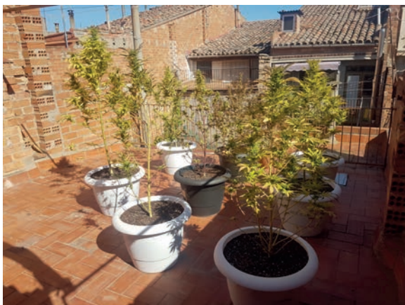
■ Imatge d'unes plantes de marihuana comissades per la Policia Local de les Borges.

El nou reglament contempla un seguit de normes de conducta pel que fa al comportament de la ciutadania a la via i als espais públics i, alhora, estableix un règim d'infraccions i sancions dins del qual es contemplen multes que poden arribar fins als 2.400 euros i permeten sancionar fets o conductes que impliquin incompliment de les obligacions o vulneracions de prohibicions establertes en la mateixa ordenança municipal. El text contempla també la possibilitat de, quan la normativa sectorial aplicable ho permeti, substituir la imposició d'una sanció econòmica per la realització per part de l'infractor de treballs en benefici de la comunitat. A l'ordenança s'estableix també que la capacitat econòmica de l'infractor serà un dels criteris que permetran graduar la quantia les sancions en aquells supòsits que la normativa ho permeti.