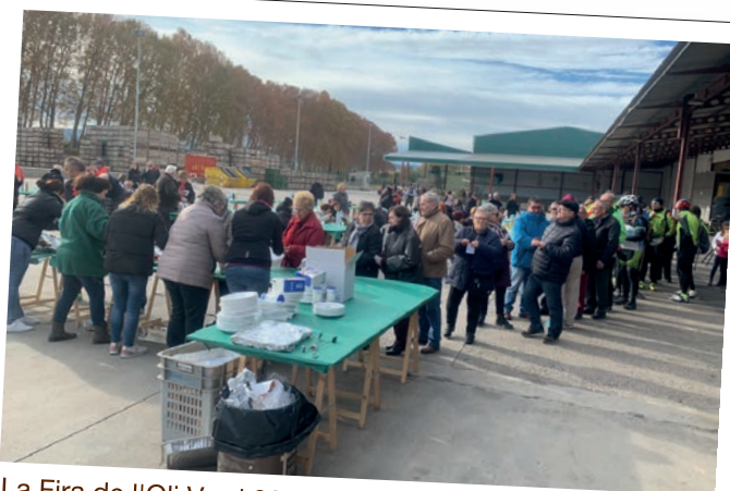
La Fira de l'Oli Verd 2019 de la Cooperativa de Sant Isidre de les Borges.