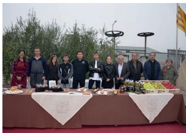
■ La presentació de la 25a Mostra Gastronòmica de les Garrigues

La promoció turística i econòmica de la comarca és present en l'organització, per 25è any consecutiu, de la Mostra Gastronòmica de les Garrigues, amb set restaurants participants amb menús elaborats exclusivament per a l'ocasió, on l'oli d'oliva verge extra és l'ingredient protagonista, sempre present a la cuina garriguenca. En aquesta edició, a més, en motiu dels 25 anys de la Mostra, s'ha volgut fer un reconeixement als restaurants participants des de l'inici, recuperant i adaptant alguns dels plats que ja s'havien fet en edicions anteriors. ■