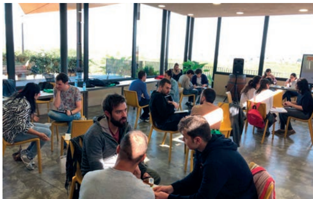
■ Participants de la jornada d'emprenedoria per a joves, ENXARXA'T