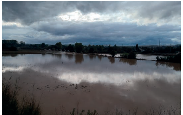
■ Danys causats en cultius per la llevantada d'octubre a les Borges

nivell de resposta adequat i suficient pel que fa a l'ajuda, i que els danys causats no afectin excessivament l'economia de famílies i del territori, prou castigat en aquest 2019 per un llarg període de sequera. En aquest sentit, el nostre compromís de seguir al costat de totes les persones que, d'una manera o una altra, s'hagin vist afectades i perjudicades, a les quals ajudarem i acompanyarem en totes les seves justes reclamacions allí on faci falta, com no podia ser d'una altra manera. ■