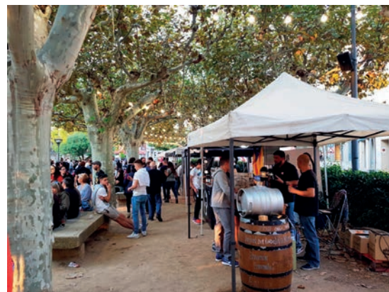
■ La 6a FIRRA de les Borges al Parc del Terrall.

Més de 2.000 persones arribades d'arreu de Catalunya van omplir el Parc del Terrall el passat 19 d'octubre per gaudir de la millor cervesa artesana de la mà dels deu elaboradors ponentins que,enguany, han portat els seus productes fins a la capital de les Garrigues. Els organitzadors de l'esdeveniment s'han mostrat satisfets amb la xifra de participants. Els dos milers de persones aplegades, en un context de repressió i mobilitzacions massives com el d'aquells dies, permet fer-ne un bon balanç.