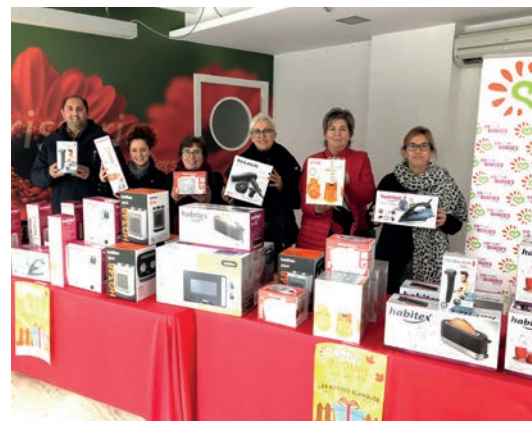
■ Els comerciants de les Borges presentant la campanya 'novembre de Regal', l'any passat.

Finalment, a principis de maig l'Agrupació col·labora en el Mercat de la Ganga que s'organitza des de fa 35 anys a les Borges, i que aplega una vintena de parades, amb importants ofertes i descomptes. ■