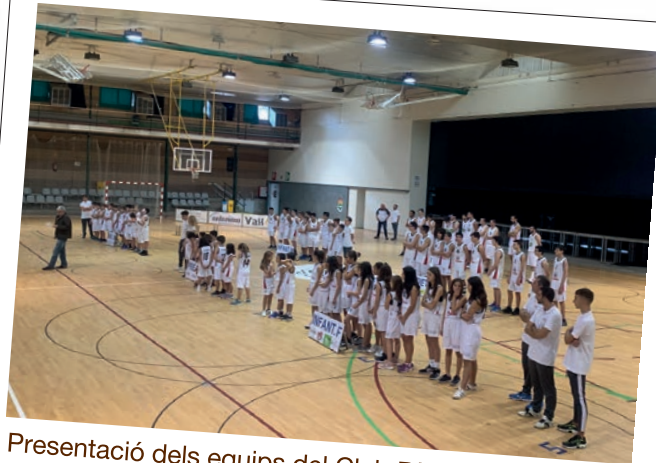
Presentació dels equips del Club Bàsquet Borges Garrigues per a la temporada 2019-2020.