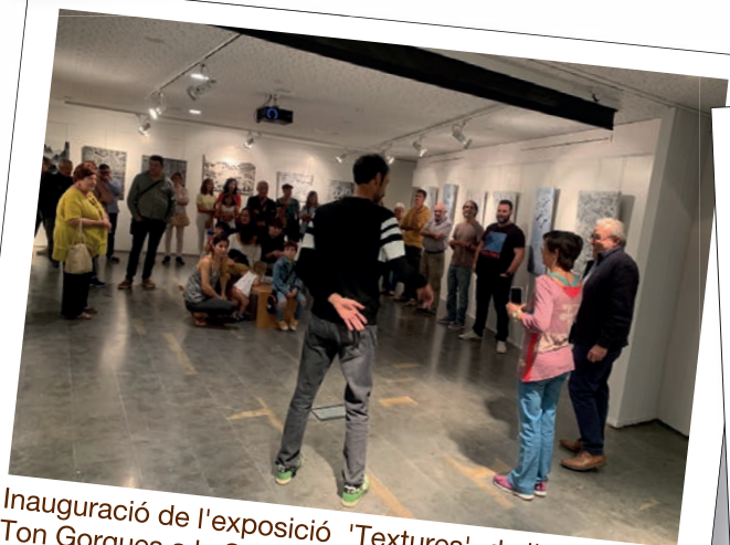
Inauguració de l'exposició 'Textures', de l'artista Ton Gorgues a la Sala Arts 25400.