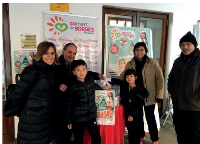
■ Foto d'arxiu de la campanya de Nadal dels comerciants de les Borges

Juntament amb aquests sortejos diaris, l'organització ha programat també dos sortejos d'extraordinaris en els quals el premi és un val de 200 euros i un d'especial al qual la quantitat la persona agraciada amb el premi serà guardonada amb un val de 300 euros. Els dos sortejos extraordinaris són els dies 24 i 31 de desembre i el sorteig especial serveix per tancar la campanya el dia 4 de gener.