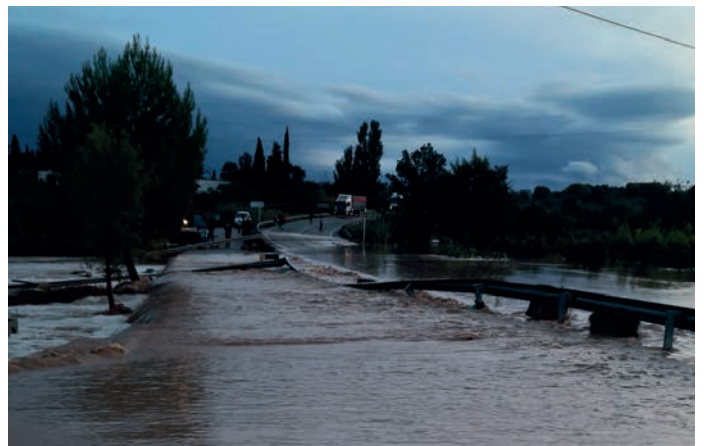
■ Alguns dels danys causats per la llevantada de l'octubre en vials de les Borges