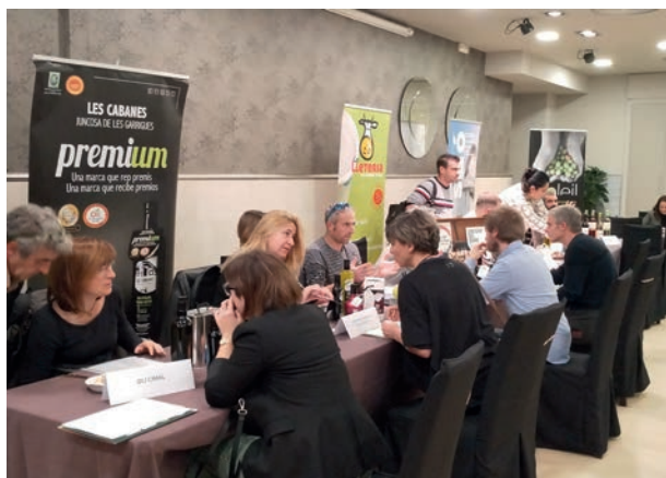
■ El networking agroalimentari que es va organitzar el 27 de novembre al Restaurant Masia les Garrigues

Durant els darrers mesos, el Consell Comarcal de les Garrigues ha donat un impuls a l'emprenedoria i promoció econòmica amb la creació de sinergies entre empreses ja existents i entre empreses noves que han apostat pel territori.